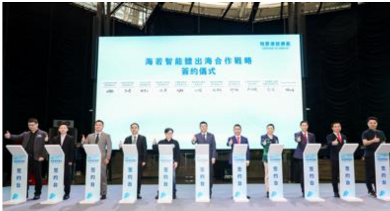
浪潮雲與香港生成式人工智能研發中心（HKGAI）及 20 家夥伴企業簽署戰略合作。