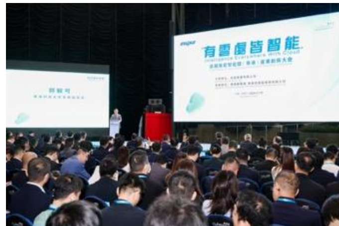
今日活動聚集多個行業夥伴出席，場面盛大。